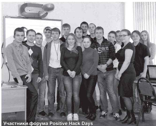
Участники форума Positive Hack Days

Многие выступления и конкурсы форума могут быть интересны и школьникам, так как позволяют будущим студентам лучше понять, чем занимаются специалисты по информационной безопасности, чего можно ждать от этой профессии. На следующий форум мы хотим пригласить учащихся школ города, которые интересуются компьютерными технологиями и защитой информации».