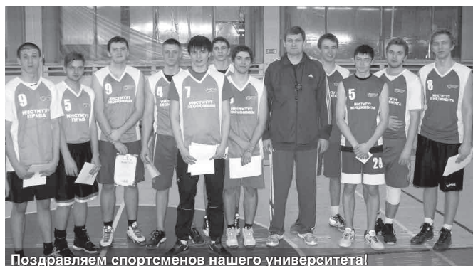
Поздравляем спортсменов нашего университета!

Мини-футбол — 1 место Фехтование — 2 место Женский волейбол — 3 место Плавание — 4 место Легкая атлетика — 5 место