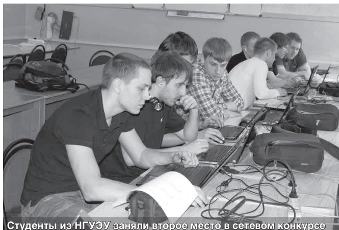
Студенты из НГУЭУ заняли второе место в сетевом конкурсе

23-го и 24-го мая в НГУЭУ кафедрой информационной безопасности была организована интерактивная площадка III Международного форума Positive Hack Days-2013, посвященного практическим вопросам информационной безопасности