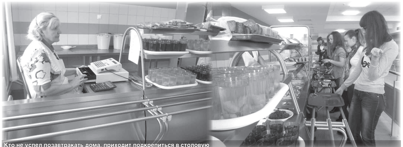
Кто не успел позавтракать дома, приходит подкрепиться в столовую