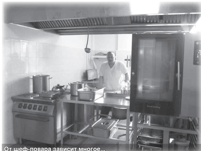
От шеф-повара зависит многое...