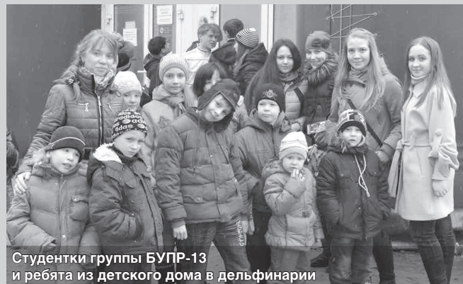
Студентки группы БУПР-13 и ребята из детского дома в дельфинарии

«Когда я смотрела на этих замечательных детей, вспомнилась строчка из песни: «Мы знаем — наша помощь им нужна, ребятам с любопытными глазами». Встав с ними в один круг, заряжаешься положительной энергией, не замечаешь, как летит время».