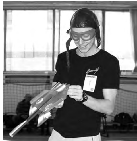
И самолет необыкновенной конструкции, и у «летчика» прикид соответствующий