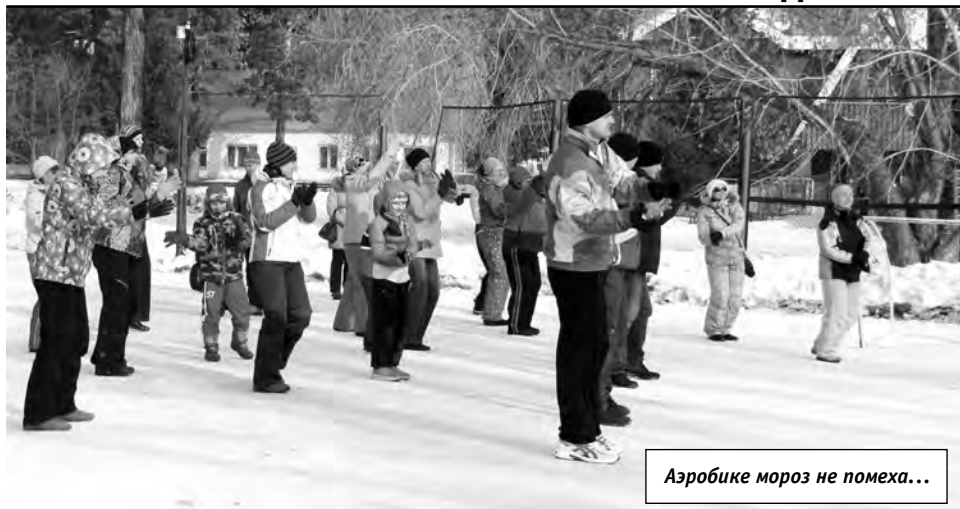
Аэробике мороз не помеха...