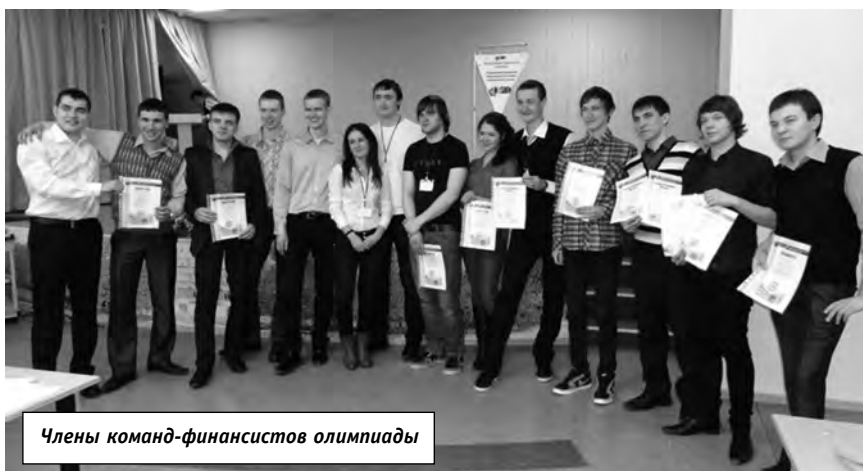
Члены команд-финансистов олимпиады