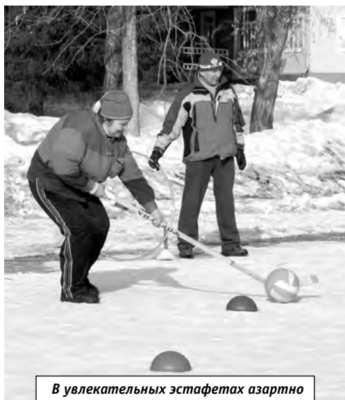
В увлекательных эстафетах азартно участвовали и взрослые, и дети

Первым делом преподаватели кафедры устроили на спортивной площадке среди сосен мастер-класс по аэробике, в котором с удовольствием приняли участие и взрослые, и дети.