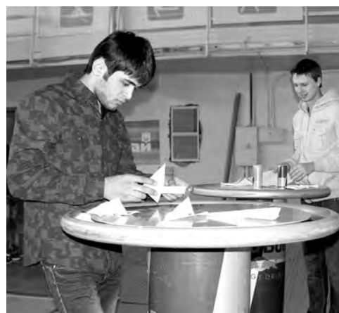
Когда приз – поездка в Москву, в работе важна каждая мелочь