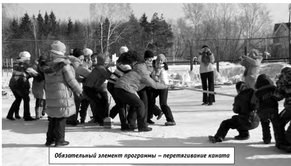
Обязательный элемент программы – перетягивание каната