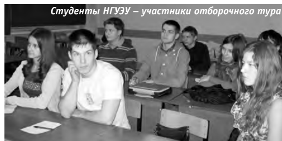
Студенты НГУЭУ – участники отборочного тура

Во время отборочного тура в НГУЭУ претендентам предстояло провести короткую самопрезентацию и решить ряд бизнес-кейсов, один из которых выглядит весьма актуальным: «Фирма договаривается с ночным клубом о проведении новогодней вечеринки, вносит предоплату, рассылает приглашения партнерам... Но за несколько дней