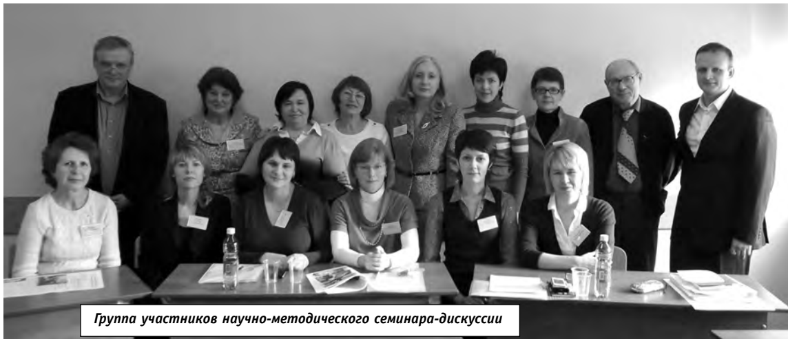
Группа участников научно-методического семинара-дискусии

корпоративные информационные системы предприятия). Самые любопытные пришли это обсудить.