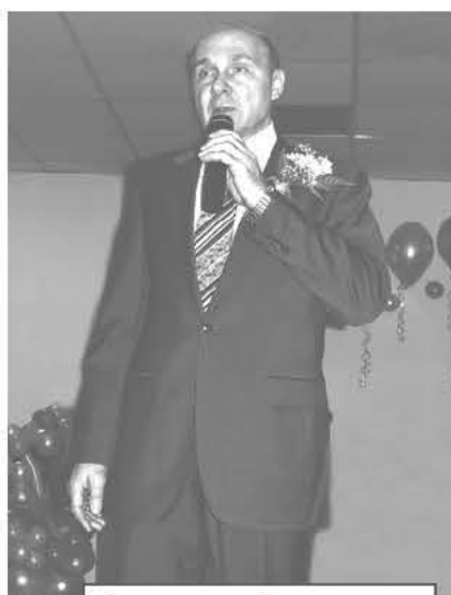
Виновник праздника тепло поздравил ректор