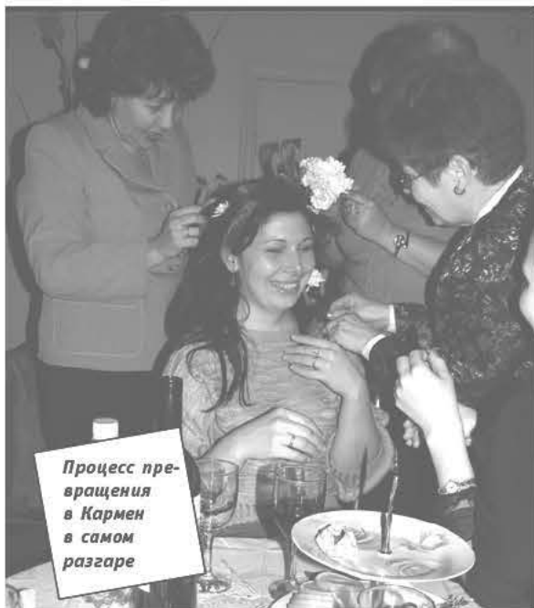
Процесс превращения в Кармен в самом разгаре