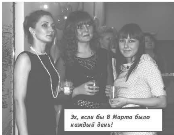
Эх, если бы 8 Марта было каждый день!