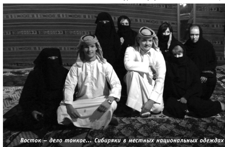
Восток – дело тонкое... Сибиряки в местных национальных одеждах

Мы летели над красивейшими горами, устлавшими территорию Казахстана и Ирана, и пока летели, снежный покров на них постепенно менялся на каменистый. Потом вместо гор появилась вода, и наконец мы увидели Дубай: не оставалось никаких сомнений в том, что это именно он – доказательством служили высоченные небоскребы, не уступающие по высоте оставшимся позади горам, и, конечно, самый высокий из них – Бурдж Дубай, буквально пронзающий небо и почти цепляющий своим шпильем шасси самолета.