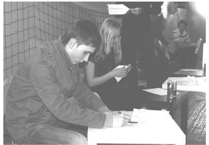
Как самолет сделаешь, так он и полетит...