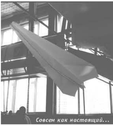
Совсем как настоящий...