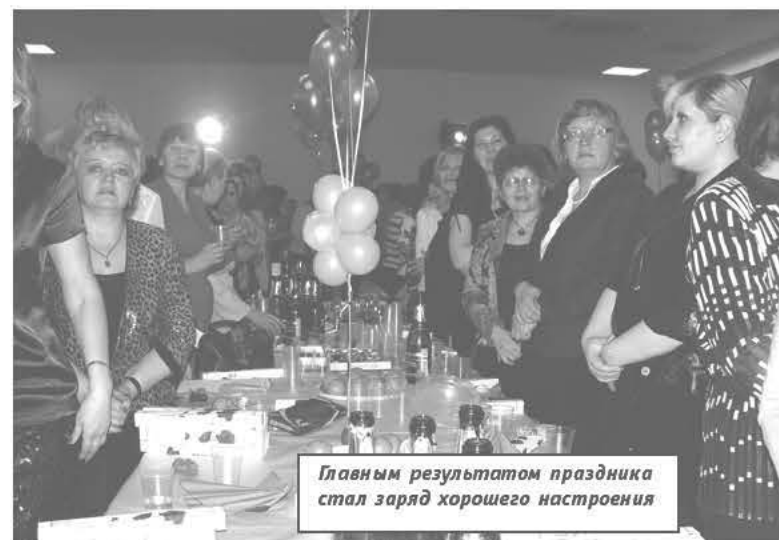
Главным результатом праздника стал заряд хорошего настроения