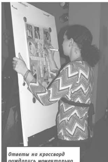
Ответы на кроссворд рождались моментально