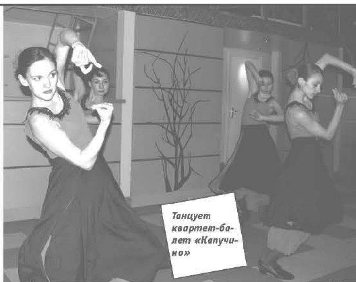
Танцует квартет-балет «Капучино»