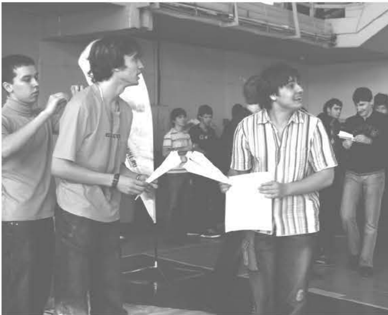
Азарта участникам было не занимать

На этом нудное изложение фактов считаю законченным. Итак, ближе к делу.