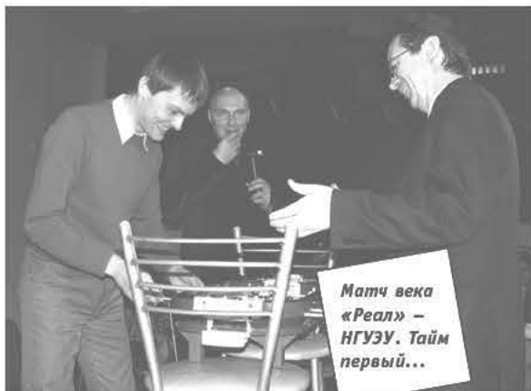
Матч века «Реал» – НГУЗУ. Тайм первый...